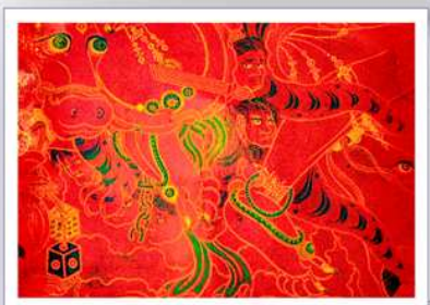
02 - "Force et Vie"