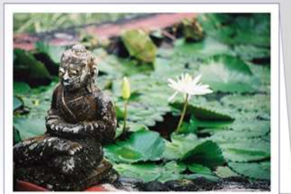
04 - "Paix"