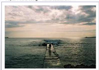
01 - "Regard vers l'horizon"

Format : Ouvert : 21 / 30 cm - Fermé 21 / 15 cm Papier : Carte 300 gr - Vernis selectif UV