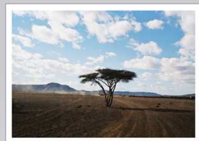
03 - "Vie"